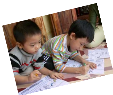
Trở tài làm họa sĩ