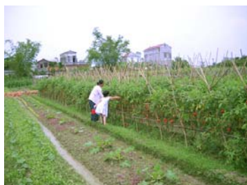
Cùng hái rau nào !