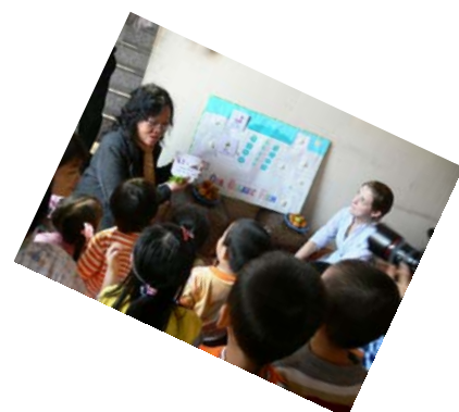
Tìm hiểu đồng ruộng hữu cơ