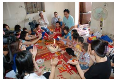
Sinh nhật thật ý nghĩa!