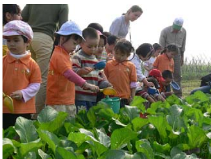
Thử làm người nông dân - Cùng tưới cây